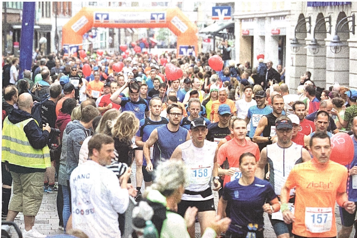
Der 2. „Flensburg-liebt-dich-Marathon“ lockt mehr als 2200 Läuferinnen und Läufer an die Förde.